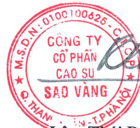
Lâm Thái Dương