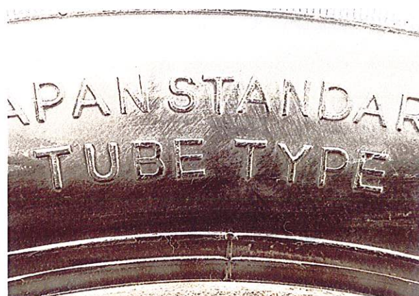
Hình 5: Lốp là loại có/không sử dụng săm