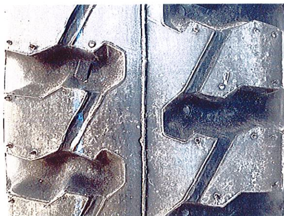
Hình 4: Mẫu vân lốp